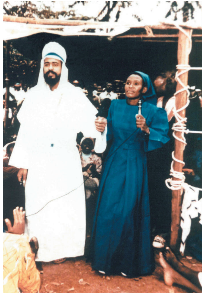
Maitreya tel qu'il est apparu à Nairobi

Le samedi 11 juin 1988, à Nairobi, au Kenya, Maitreya est apparu devant un groupe de prière et de guérison. Il fut photographié alors qu'il s'adressait, en parfait swahili, à des milliers de personnes qui l'ont instantanément reconnu comme le Christ. Il disparut de manière aussi mystérieuse qu'il était venu. Des médias internationaux, dont la BBC et CNN, ont diffusé des photographies prises lors de cet événement.