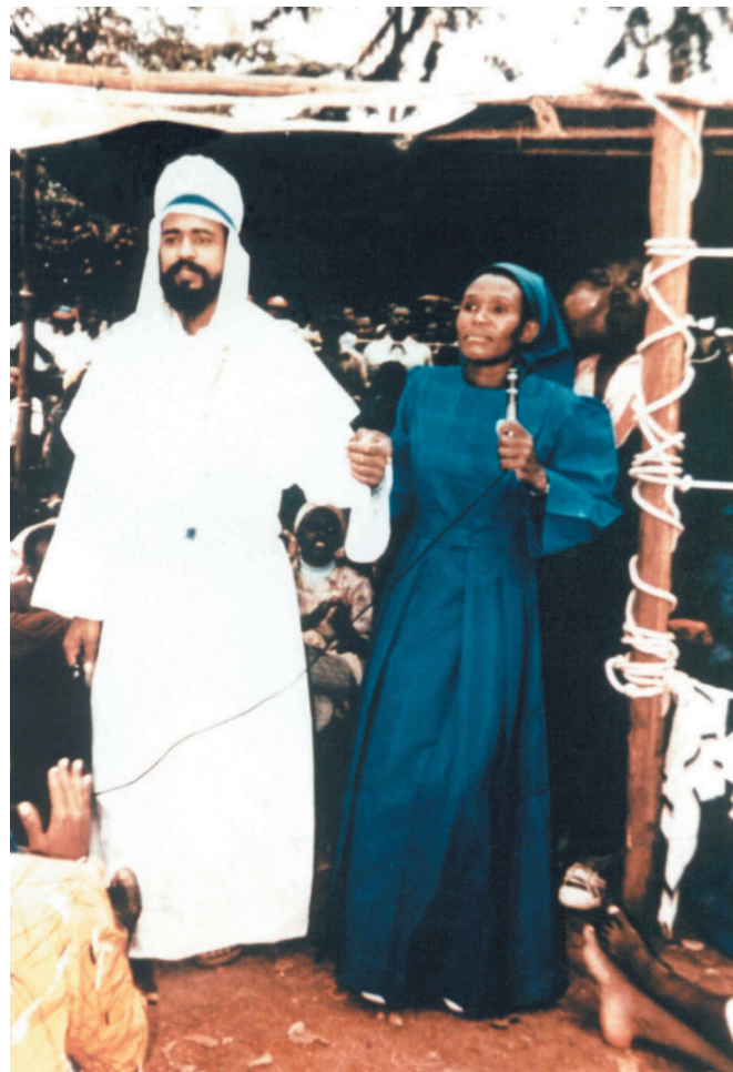
Maitreya tel qu'il est apparu à Nairobi

Le samedi 11 juin 1988, à Nairobi, au Kenya, Maitreya est apparu devant un groupe de prière et de guérison. Il fut photographié alors qu'il s'adressait, en parfait swahili, à des milliers de personnes qui l'ont instantanément reconnu comme le Christ. Il disparut de manière aussi mystérieuse qu'il était venu. Des médias internationaux, dont la BBC et CNN, ont diffusé des photographies prises lors de cet événement.