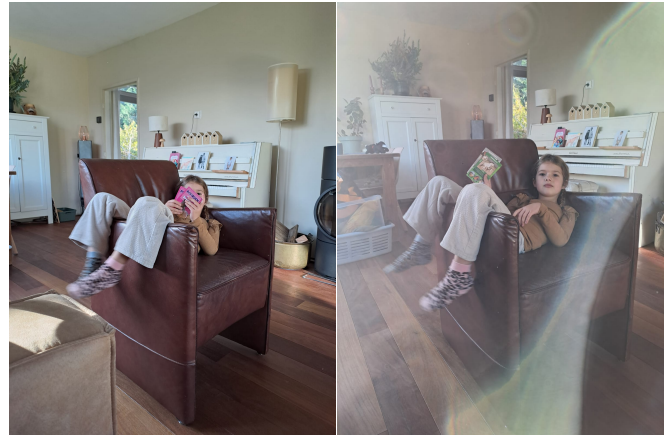
Photographies prises le 27 octobre 2025, montrant N. M. N., sans la bénédiction.