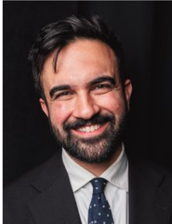
Zohran Mamdani

En novembre 2025, Zohran Mamdani, socialiste démocrate de 34 ans, est devenu le 111 e maire de New York, et le premier maire musulman de cette ville. Cette victoire semble être une bonne nouvelle isolée, mais on peut y voir la preuve de l'existence d'un nouveau courant de pensée.