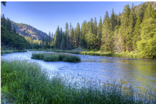
Le Klamath, 2 e plus grand fleuve de Californie

En 2024, dans le cadre du plus grand projet de ce type jamais réalisé aux Etats-Unis, le dernier des quatre barrages hydroélectriques a été supprimé sur le Klamath, un fleuve qui se situe à la frontière entre la Californie et l'Oregon.