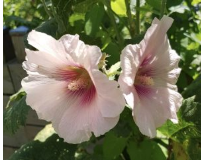
Rose trémière rose