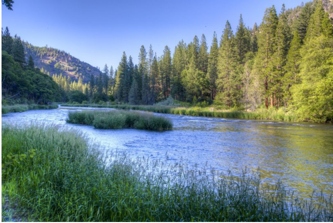
Le Klamath, 2 e plus grand fleuve de Californie

En 2024, dans le cadre du plus grand projet de ce type jamais réalisé aux Etats-Unis, le dernier des quatre barrages hydroélectriques a été supprimé sur le Klamath, un fleuve qui se situe à la frontière entre la Californie et l'Oregon.