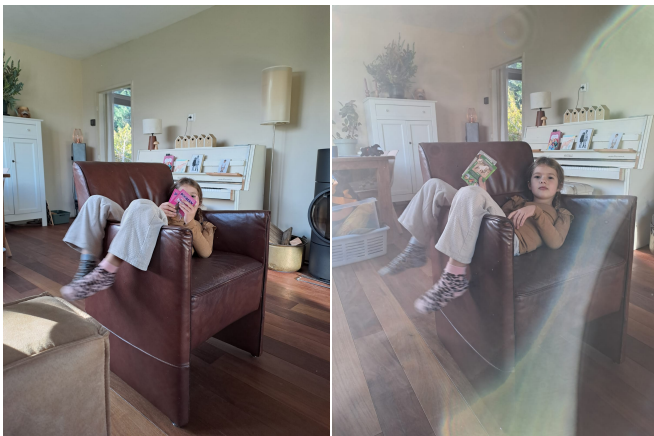
Photographies prises le 27 octobre 2025, montrant N. M. N., sans la bénédiction.