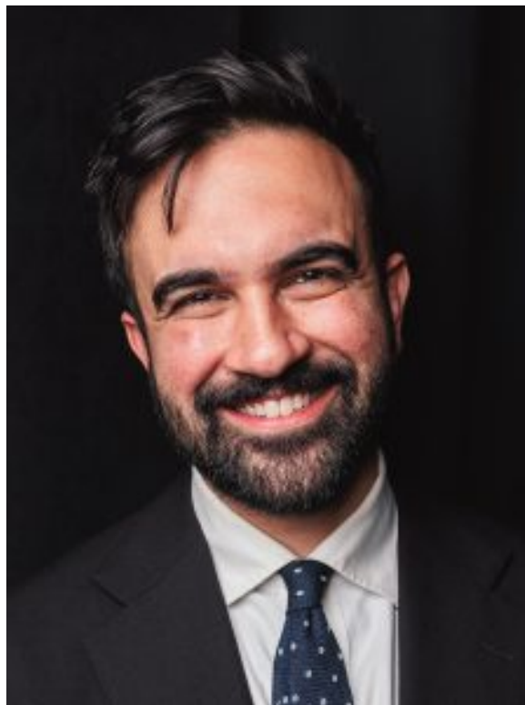
Zohran Mamdani

En novembre 2025, Zohran Mamdani, socialiste démocrate de 34 ans, est devenu le 111 e maire de New York, et le premier maire musulman de cette ville. Cette victoire semble être une bonne nouvelle isolée, mais on peut y voir la preuve de l'existence d'un nouveau courant de pensée.