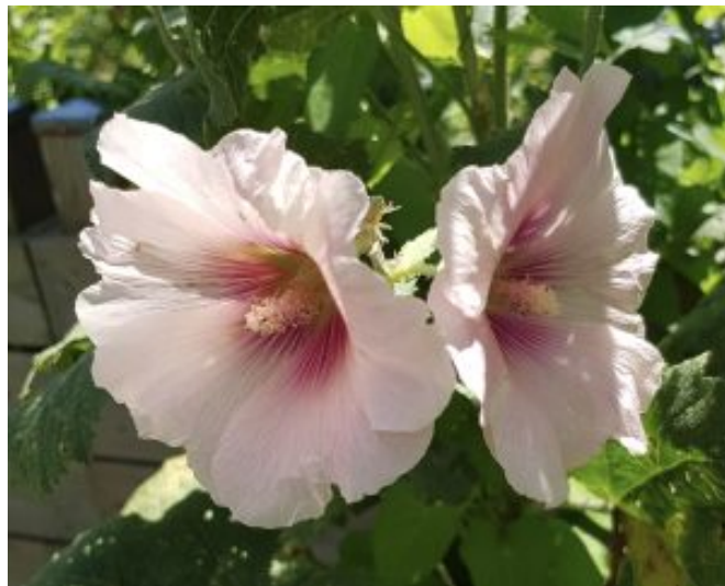
Rose trémière rose