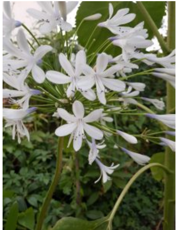
Lys du Nil blanc

En 2023, quelque chose de semblable s'était déjà produit avec une autre plante, un lys du Nil (ou agapanthe). Au printemps, j'avais vu en jardinerie des lys du Nil blancs, que j'avais trouvés magnifiques. J'avais eu envie d'en acheter un, mais pour différentes raisons j'avais renoncé à cet achat, non sans quelque regret.