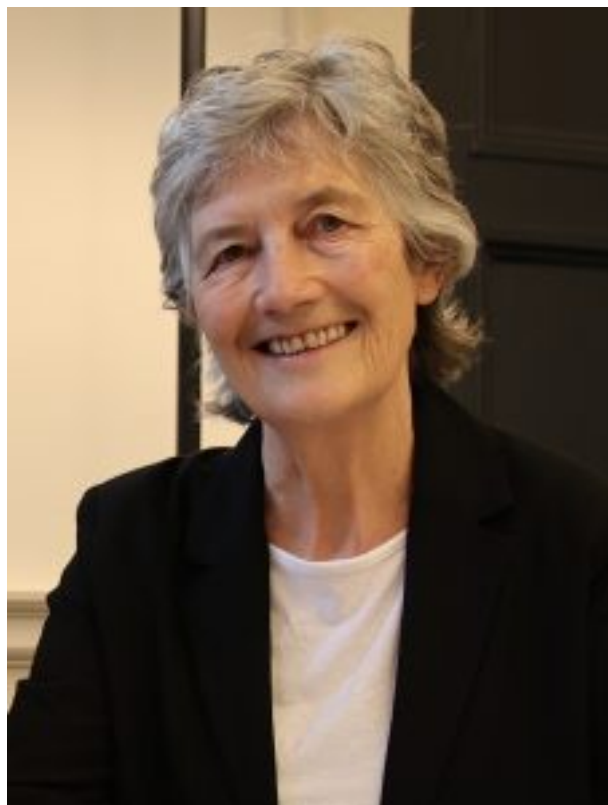
Catherine Connolly

Catherine Connolly, candidate indépendante de la gauche, est devenue la 10 e présidente de l'Irlande après avoir remporté les élections avec une large majorité, obtenant 63% des voix au premier tour. Cette ancienne psychologue clinicienne et avocate de 68 ans s'est engagée à être la porte-parole de tous les Irlandais et à œuvrer pour la paix.