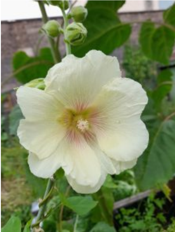
Rose trémière jaune pâle

Le 22 juillet de cette année, avec ma femme Rose-Marie nous avons eu une surprise en allant au jardin : une rose trémière qui jusque-là produisait des fleurs jaune pâle s'était parée de deux magnifiques fleurs de couleur rose, voisines l'une de l'autre.