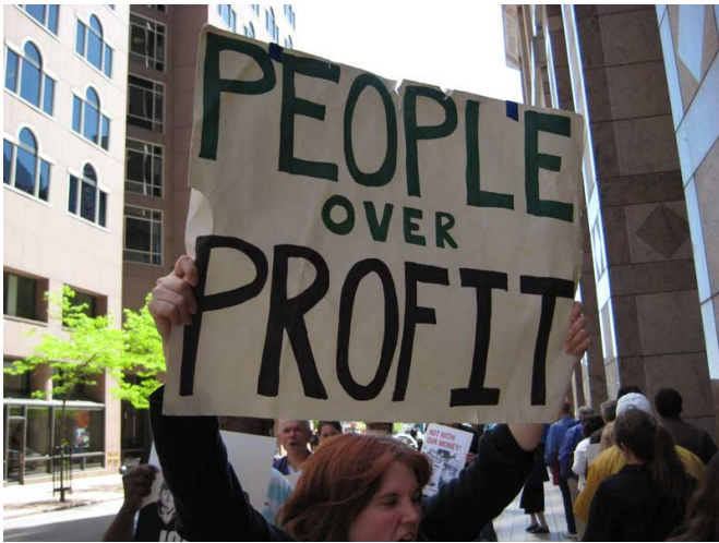
« Les peuples avant les profits ! »

l'humanité. [ Le rassemblement des forces de Lumière (B. Creme)]