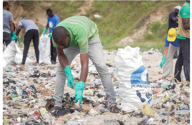
Au niveau mondial, 73 % des déchets de plage sont en plastique, y compris les filtres à cigarettes, les bouteilles, les emballages alimentaires, les sacs en polyéthylène et les poubelles.

Les phtalates sont une autre classe d'additifs nocifs, que l'on trouve notamment dans les emballages alimentaires et qui perturbent la fonction endocrinienne des animaux et des humains.