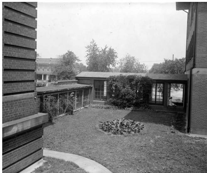
Un hôpital homéopathique à Washington DC (Etats-Unis). La photo est datée entre 1910 et 1926.

Le mouvement des « soins moraux » propose divers modèles. Il s'est inspiré d'une ville belge, Geel, où les fous étaient placés dans des familles d'accueil. Personne n'essayait de les soigner. Ils étaient tolérés et traités avec affection. Ce mode de fonctionnement a inspiré de nombreux asiles.