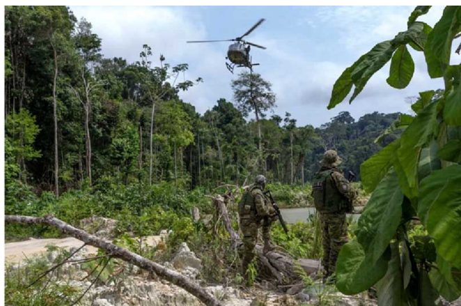
Opération de l'agence environnementale brésilienne contre l'extraction minière illégale dans le nord de l'Etat du Parà en mars 2024.

des espèces d'arbres les plus vieilles et les plus grandes de l'Amérique tropicale. Et une nouvelle étude révèle que la protection de l'Amazonie est plus étendue que ce qu'on en croyait, avec 62,4 % de la forêt tropicale qui bénéficie à présent d'un programme de gestion de la préservation.