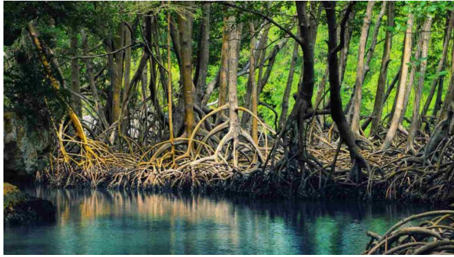
Mangroves du parc national de Sundarban (Inde)

Dans une étude réalisée en 2020 (dont les auteurs sont M. Menendez et Michael Beck, directeur du Centre pour la résilience climatique des côtes), les chercheurs ont déterminé que, sans les mangroves, 15 millions de personnes supplémentaires dans le monde subiraient des inondations chaque année. L'étendue des forêts de mangroves, ainsi que la taille, la forme et la densité des arbres, contribuent à réduire l'impact des vagues. Leurs racines stabilisent également le sol et préviennent ainsi l'érosion. Les mangroves poussent le long des eaux côtières dans les régions tropicales et subtropicales. Elles prospèrent dans des sols à faible teneur en oxygène et sont même capables de pousser dans l'eau salée.