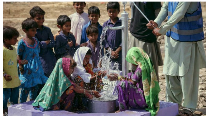
Selon l'OMS, 2 milliards de personnes manquent d'accès à de l'eau potable.

versant 4 , qui sont très souvent transfrontaliers et multi-utilisateurs. La gestion de l'eau ne peut donc se faire que par la coopération au sein d'un bassin versant ou d'un aquifère, entre les pays ou régions concernés, et entre toutes les catégories d'utilisateurs (agriculteurs, industriels, résidents et touristes). La coopération entre ces acteurs est impérative et nécessaire pour réduire les tensions et les conflits.