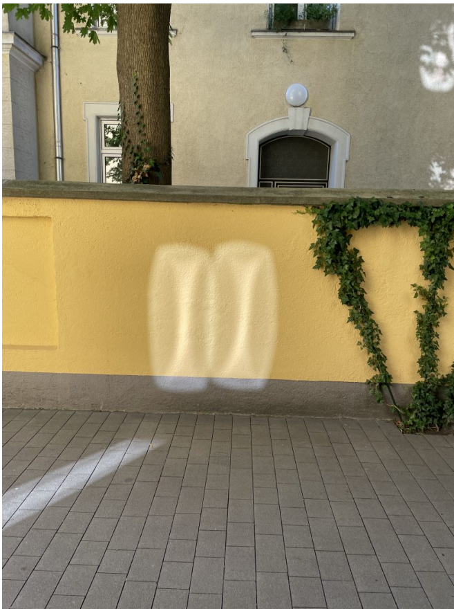
Cercles de lumière sur un bâtiment à Munich (Allemagne)