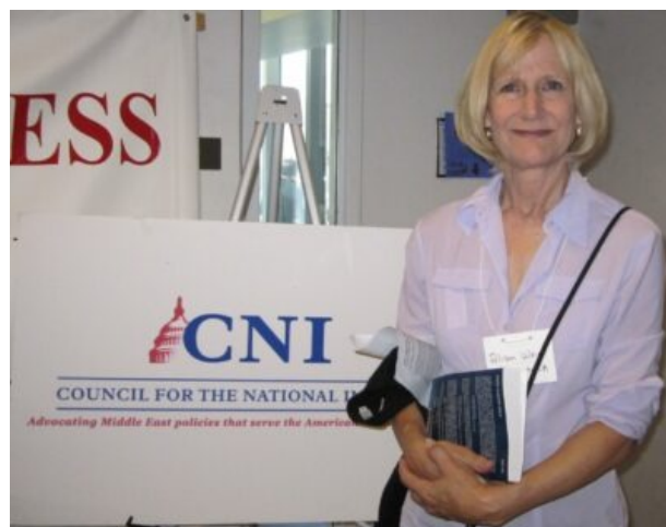
Alison Weir, journaliste indépendante et militante

AW . Je dirais que cela a commencé bien avant, avec le premier Congrès sioniste en 1897. Mais pour en revenir à aujourd'hui, c'est profondément problématique pour les Américains puisque le gouvernement américain finance Israël, le protège sur la scène internationale et pour cette raison, les Américains sont probablement les moins bien informés.