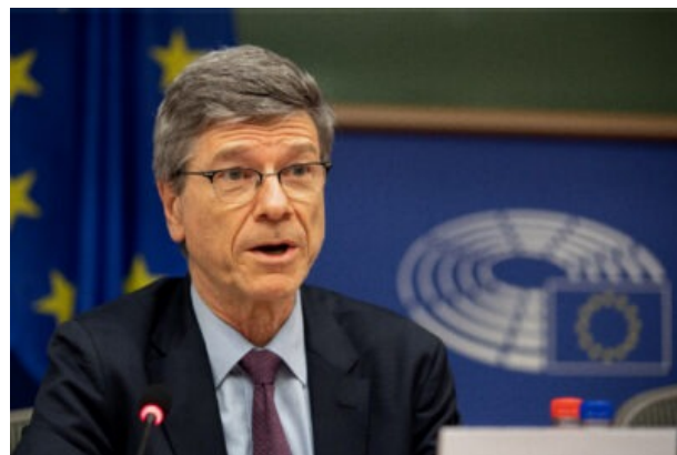
Jeffrey Sachs, économiste américain

sécurité de l'Onu et de l'Assemblée générale, permettant à la fureur israélienne de continuer. De plus, alors que la guerre fait rage à Gaza, les États-Unis poursuivent leur dangereuse tentative d'élargissement de l'Otan pour y intégrer l'Ukraine, malgré les objections les plus vives de la Russie. Nous en voyons le résultat dans une guerre par procuration entre les États-Unis et la Russie, qui est en train de détruire l'Ukraine.