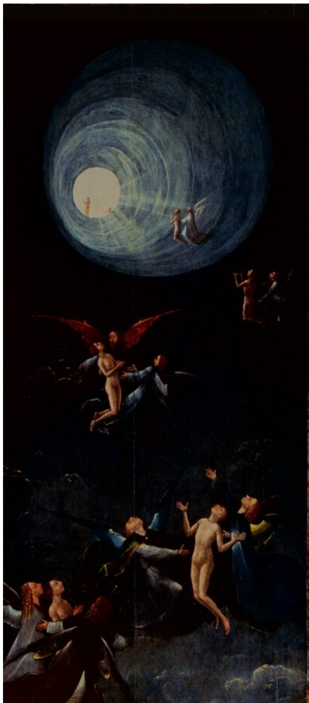
Photo : Hieronymus Bosch