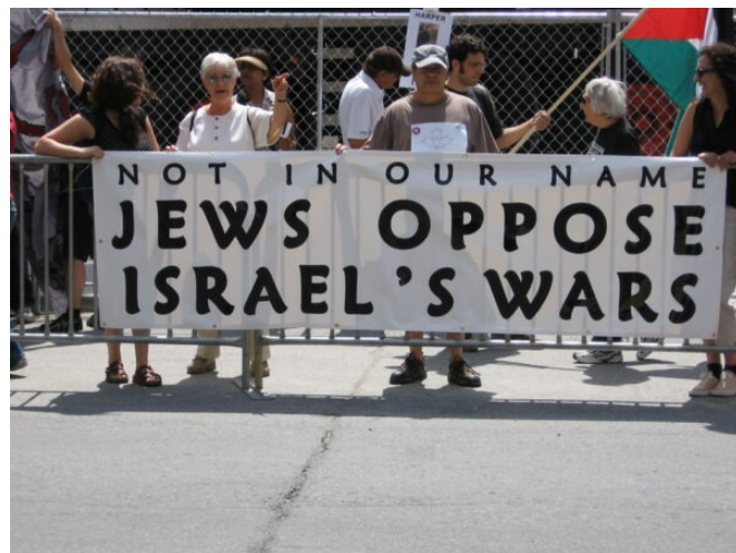
Sur la pancarte on peut lire : « Pas en notre nom : les Juifs s'opposent aux guerres menées par Israël. »

Quels que soient les médias que nous consultons, nous ne voyons qu'une fraction de la gigantesque démonstration d'inhumanité qui se produit à Gaza, la réduction de personnes vivantes, respirantes et sensibles à l'état d'objets. C'est sans cœur. C'est sans âme. Cela réduit toute l'existence au néant, à de la fumée, de la fumée humaine.