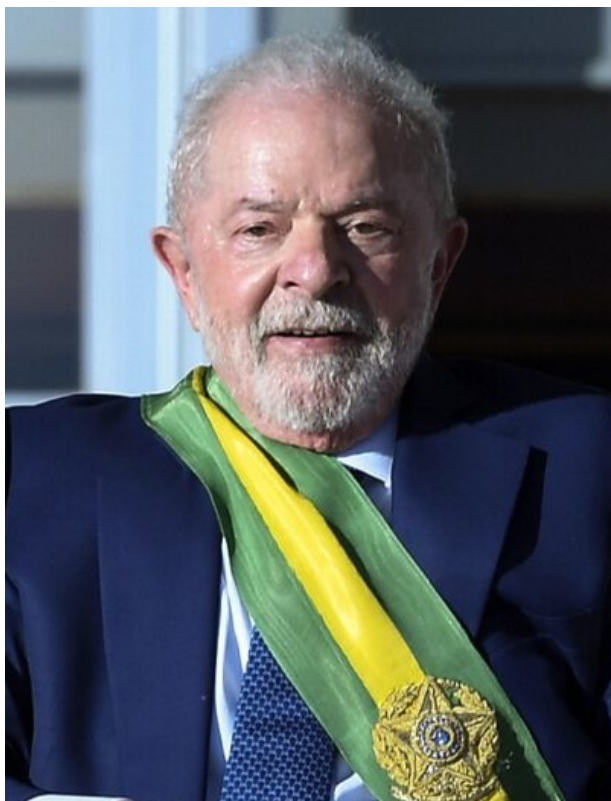
Luiz Inacio Lula da Silva

Le monde semblait prendre une direction rétrograde et destructrice lorsque Donald Trump et Jair Bolsonaro dirigeaient respectivement les États-Unis et le Brésil, et que David Malpass présidait la Banque mondiale. Aujourd'hui, la situation semble très différente sous la présidence de Joe Biden, de Luiz Inacio Lula da Silva (mieux connu sous le nom de Lula) et très probablement d'Jay Banga s'il est élu comme le prochain président de la Banque mondiale.