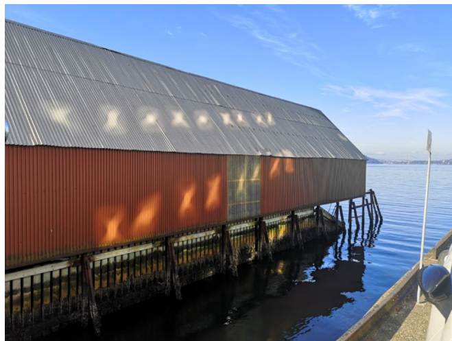
Cette photo a été prise à Sandviken, près du centre-ville de Bergen (Norvège), le 30 août 2022. A. M. K