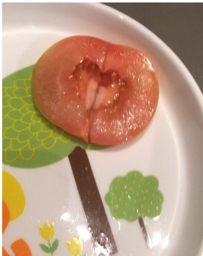
L'intérieur en forme de cœur d'une tomate coupée le 25 janvier 2020. M. T., Vancouver (Canada)