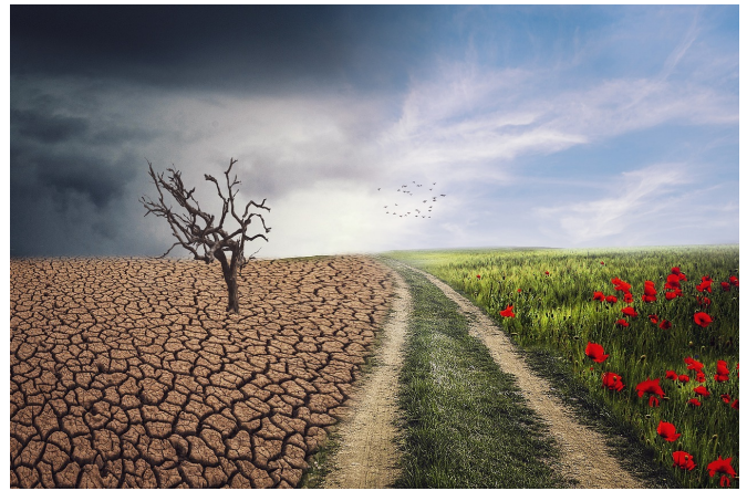
Une des causes les plus fondamentales de notre course vers l'abîme est notre rapport presque religieux à la croissance économique, vue comme la plus importante mesure de progrès, le PIB étant lui-même déterminé par la consommation.

Un chapitre est consacré à une mesure du progrès humain qui diffère du PIB, et qui fut introduite au Bhoutan en 2008 : l'indice de bonheur national brut, qui désigne le bonheur et le bien-être, plutôt que la croissance, comme objectif de l'économie. La signification du bonheur dans ce contexte est relationnelle, ainsi que l'explique Jigme Thinley, premier ministre du Bhoutan : « Le bonheur durable et véritable ne peut exister tant que d'autres souffrent, et il ne peut provenir que du service aux autres, de la vie en harmonie avec la nature, et de la réalisation de notre sagesse intérieure et de la nature véritable et splendide de notre propre esprit. »