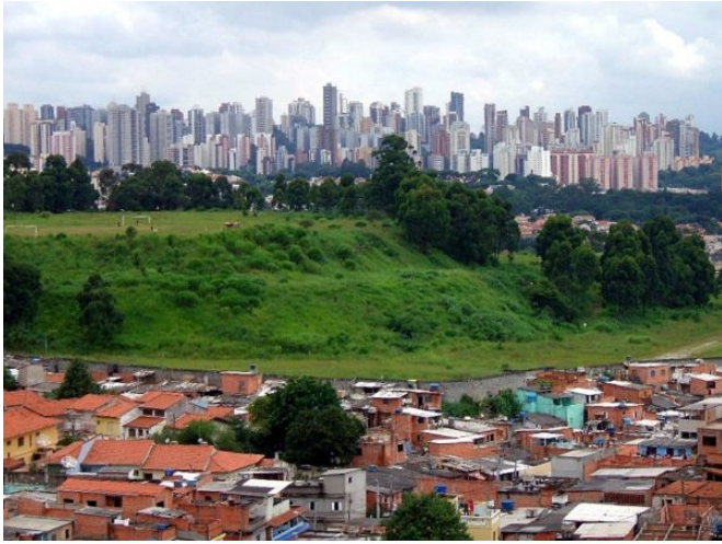
Le monde souffre d'une très forte inégalité des revenus et d'une extrême inégalité des richesses.

La distribution des revenus est donc très inégale. Mais l'allocation du patrimoine l'est encore plus. Les 50 % du bas de la population mondiale possèdent seulement 2 % du patrimoine mondial net (2 900 euros en moyenne, généralement en espèces, dépôts, terrains ou logements). En d'autres termes, la moitié la plus pauvre ne possède presque rien. A l'autre extrémité, les 10 % du haut possèdent 76 % du patrimoine mondial, et au sein de ce groupe, le 1 % du haut possède pas moins de 38 %. Pour résumer, le monde souffre d'un niveau très élevé d'inégalités de revenus, et d'un niveau extrême d'inégalités de patrimoine.