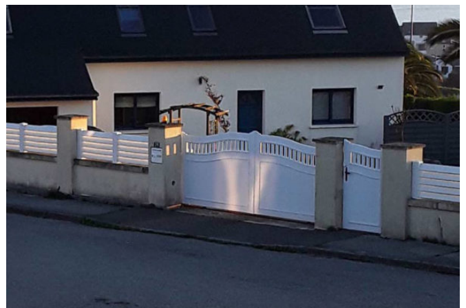
Formations lumineuses sur le portail d'un pavillon à Camaret (France).