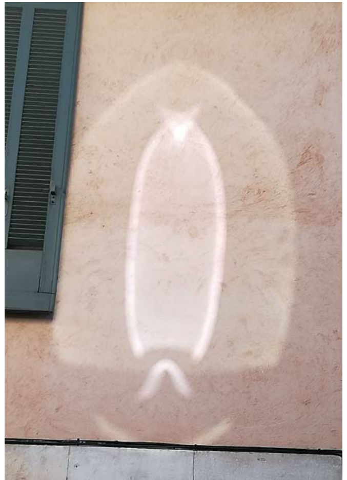
Formation lumineuse prise à Nîmes (France), rue Stanislas Clément, en janvier 2019. Forme peu commune.