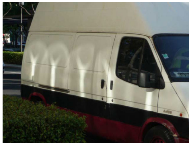
Formations lumineuses sur une camionnette garée avenue Jean Jaurès, à Nîmes (France). Photo prise en juillet 2016, par D. B.