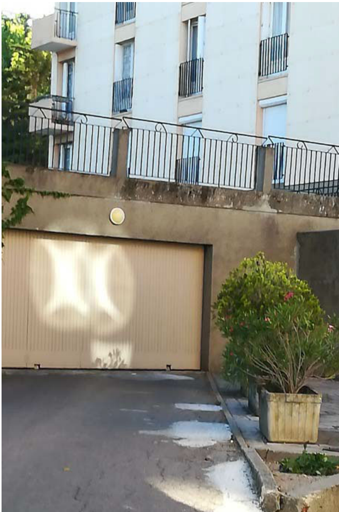
Formations lumineuses rue du Dr Lamaze, à Nîmes (France).