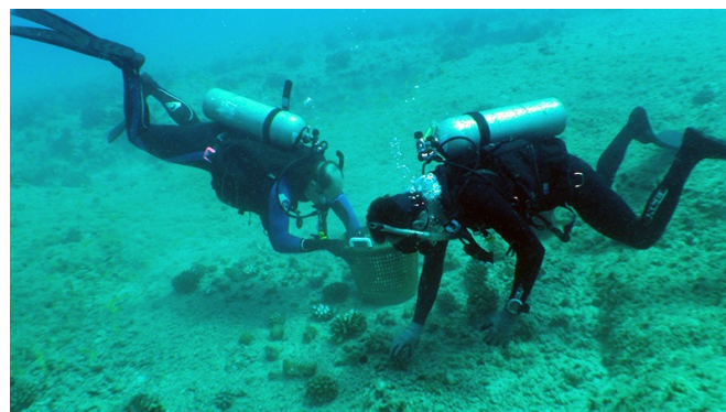
Le Centre communautaire des plongeurs et des Ambassadeurs de la mer vise à protéger la mer et ses écosystèmes tout en travaillant au sein de la communauté pour son profit.

mer et ses écosystèmes tout en travaillant au sein de la communauté pour son profit. La plongée sous-marine y est trop chère pour être autre chose qu'une activité touristique ; mais en offrant la possibilité de « plonger avec un but » et en rendant l'activité intéressante et amusante, l'organisation combat le chômage et le désespoir des jeunes de la région, tout en protégeant les récifs de corail. Etant donné qu'elle est « animée localement », et non par une ONG extérieure, elle n'est pas prête de disparaître.