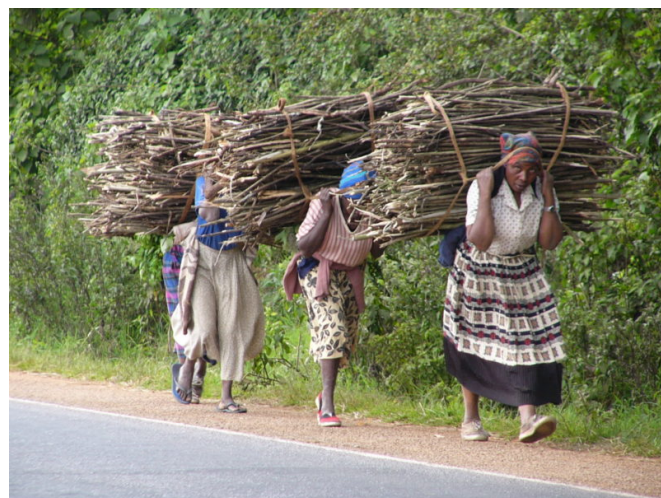
Pour couronner le tout, les pays et les communautés les plus pauvres, qui n'ont rien fait ou presque pour provoquer le changement climatique, sont les plus durement touchés par ses effets dévastateurs.

des émissions de GES, est le plus grand émetteur mondial, mais elle n'occupe que la 47 e place en termes d'émissions par habitant. La Chine est également l'un des plus grands investisseurs mondiaux dans les énergies renouvelables, et prévoit de produire 35 % de son électricité à partir de sources renouvelables d'ici 2030. Ce sont les Etats-Unis (328 millions d'habitants), deuxième pollueur mondial, qui ont les émissions par habitant les plus élevées au monde, et de loin. Ensemble, les quatre principaux émetteurs (Chine, Etats-Unis, UE plus Royaume-Uni et Inde) ont produit 55 % de l'ensemble des émissions de GES au cours de la dernière décennie.