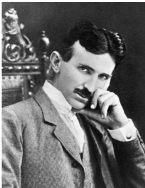
Nikola Tesla