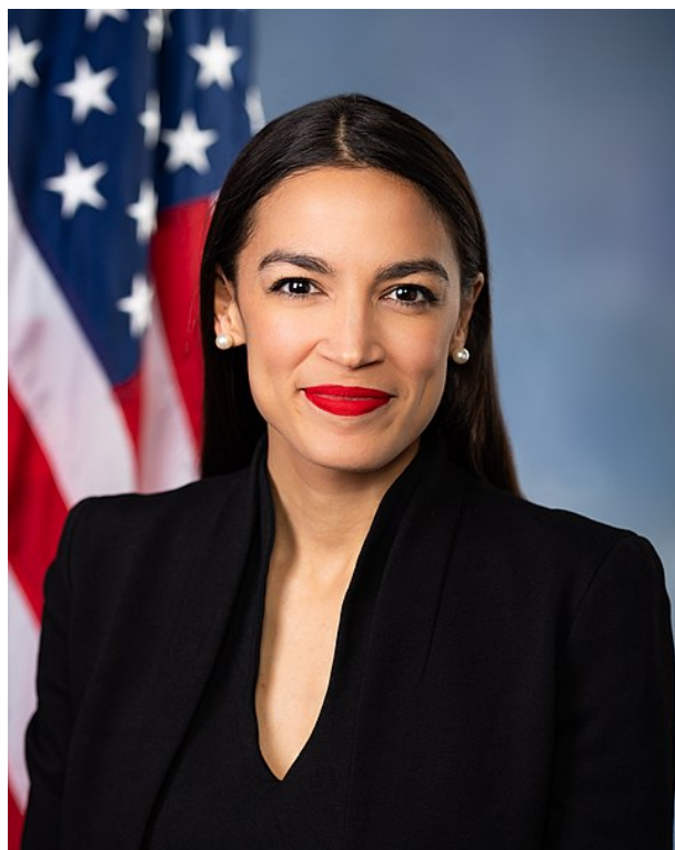
Alexandria Ocasio-Cortez

faire ? Et comment pouvons-nous être plus conscients de nos actes ? Ce n'est pas : que voulez-vous être, mais comment voulez-vous être ? Et c'est ce qui a toujours guidé mes décisions.