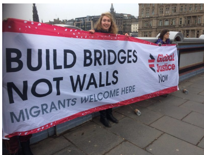
Une certaine vision du changement inspire désormais les multitudes, qui bientôt captera l'attention du monde tout entier. Les hommes ont compris que, lorsqu'ils s'organisent et font preuve de courage, ils sont invincibles. Rien ne pourra arrêter l'actuel mouvement pour le changement.

Il ne faut pas oublier qu'il n'est jamais demandé à quelqu'un plus qu'il ne peut faire - jamais. C'est une loi. Il n'est jamais demandé à quelqu'un de faire plus qu'il n'est capable de faire par sa constitution - c'est-à-dire de par sa structure de rayons, son niveau d'évolution, son éveil, sa santé, son âge, etc. C'est une chose dont il faut se souvenir. Les seules choses qui peuvent éventuellement vous empêcher de faire tout ce que vous êtes capables de faire sont la peur, la paresse, l'inertie, le sentiment de ne pas être à la hauteur - qui est une autre façon de nommer la peur. Le manque de courage est aussi une autre manière de nommer la peur. [La Mission de Maitreya, tome II (B. Creme)]