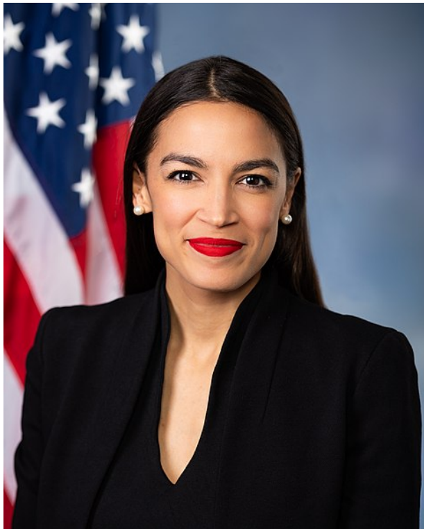
Alexandria Ocasio-Cortez

faire ? Et comment pouvons-nous être plus conscients de nos actes ? Ce n'est pas : que voulez-vous être, mais comment voulez-vous être ? Et c'est ce qui a toujours guidé mes décisions.