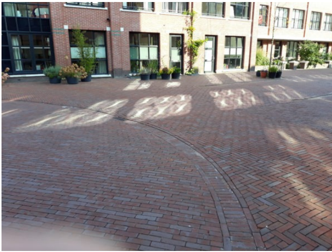
Formations lumineuses à Amsterdam (Pays-Bas). Photo de C. de H., juin 2008.