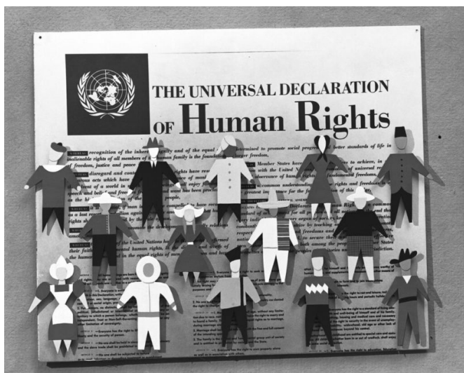
Des centaines de millions de personnes n'ont pas accès à suffisamment de nourriture, sans parler de leurs autres besoins.

Il est d'ailleurs intéressant de constater qu'historiquement, le principe de besoin a été formulé plus tardivement que le principe de juste rétribution. Cela s'explique probablement par le contexte de rareté dans lequel l'humanité a vécu pendant des siècles. Lorsque la production était à peine suffisante pour couvrir les besoins les plus élémentaires de la majorité, l'accent devait nécessairement être mis sur la responsabilité qu'avait chacun de travailler dur pour accroître les rendements, et le principe de juste rétribution apparaissait alors comme la plus haute manifestation possible de la justice économique. Aujourd'hui, la situation est radicalement différente, grâce aux formidables avancées scientifiques, technologiques et organisationnelles des deux derniers siècles. Au niveau agrégé, nous produisons maintenant bien plus que ce qui est nécessaire pour couvrir les besoins de base de toute l'humanité, et le principe de besoin est donc devenu un objectif réaliste.