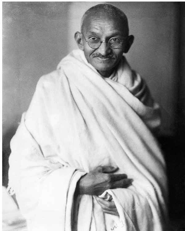
Mahatma Gandhi

La non-violence est une pratique personnelle et collective d'innocuité vis-à-vis des autres et de soi en toutes circonstances. Ces dernières années, c'est aussi devenu une méthode courante pour obtenir des changements politiques et sociaux.