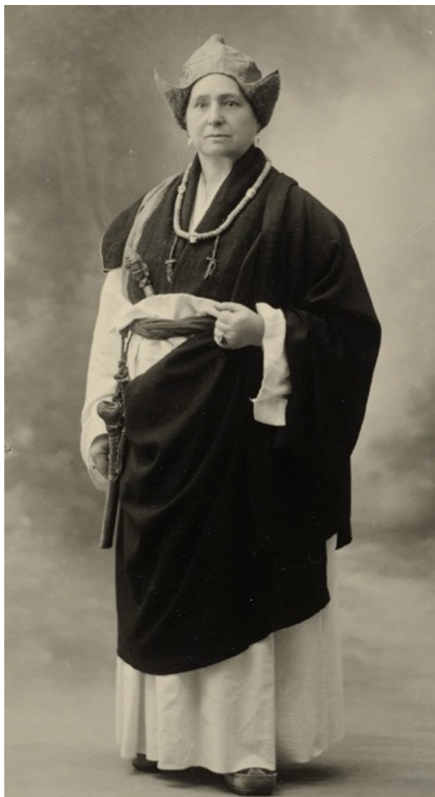
Alexandra David-Néel

La vie d'Alexandra David-Néel (1868-1969) est certes remarquable par sa longévité exceptionnelle d'un siècle, mais elle l'est davantage encore par le foisonnement de ses activités et de ses centres d'intérêt, et par la multiplicité de ses voyages dans un Orient encore largement méconnu, mystérieux et difficilement pénétrable. Orientaliste et tibétologue, chanteuse d'opéra et féministe, journaliste et anarchiste, écrivaine et exploratrice, franc-maçonne et bouddhiste, c'est avec une volonté indomptable qu'elle mène sa vie débordante.