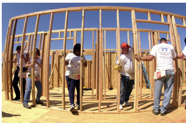
Surmontons cette crise, et ensuite réduisons la distance qui nous sépare, abattons les murs que nous érigeons entre nous.

La « distanciation sociale » (ou peut-être plus exactement « l'espacement physique approprié ») est une mesure que l'humanité doit pratiquer à court terme pour surmonter la crise du Covid-19. Et ce ne sera probablement pas la dernière fois, malheureusement, qu'une pandémie nous menacera.