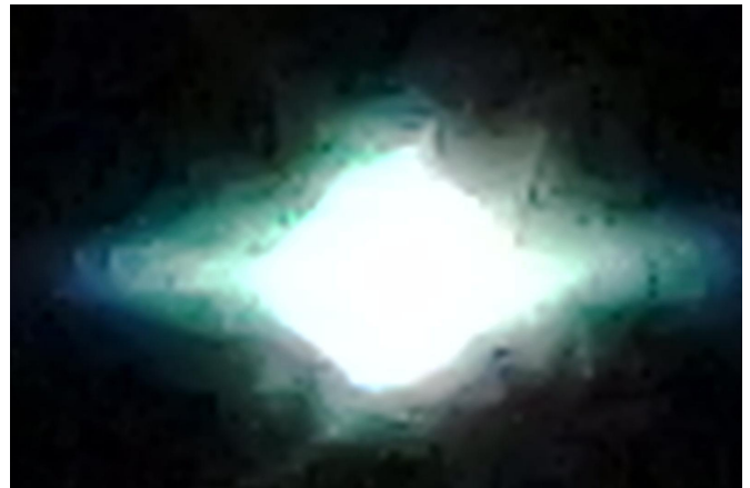
Vers 22 h, entre le 8 et le 24 mars 2020, des membres des groupes de méditation de transmission du Brabant ont observé une lumière brillante inhabituelle.

Argentine - « J'ai observé 22 objets alignés du nord au sud se déplaçant à presque même distance l'un de l'autre, ressemblant à des étoiles mais de couleur jaune. J'ai pensé que c'était des satellites comme j'en vois toujours, mais jamais plus de deux... » (La Vanguardia, Espagne)