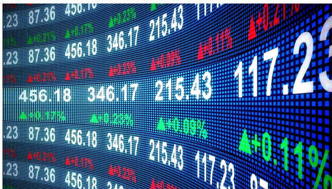
Panneau de marché boursier