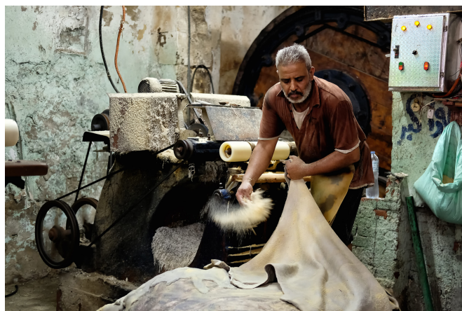
Tannage traditionnel du cuir

Une entreprise de biotechnologie de Caroline du Nord, Cultivated Biomaterials, a produit du cuir à partir de cellules provenant d'une vache vivante. George Engelmayr, l'ingénieur biomédical qui a fondé l'entreprise, cultive les cellules sur des supports végétaux fabriqués à partir de matériaux tels que du duvet de pissenlit et des fibres d'asclépiade. Une fois qu'il est tanné, le cuir à maturité est traité avec des poudres d'écorce d'arbre plutôt que des produits chimiques agressifs utilisés par la plupart des tanneries, ce qui n'est pas nocif à l'environnement.