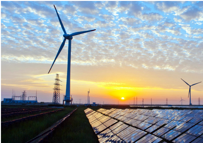
Panneaux solaires, éoliennes et pylônes électriques

L'Europe est actuellement confrontée à une crise énergétique due aux événements du Moyen-Orient, qui font grimper les prix du pétrole et du gaz. Cependant, un nouveau rapport révèle que l'électricité dans certains pays européens a été près de 25 % moins chère entre 2023 et 2025 grâce aux énergies renouvelables. De plus, une analyse de SolarPower Europe a révélé que l'énergie solaire a permis à l'Europe d'économiser plus de 100 millions d'euros par jour en 2026 depuis le 1 er mars, soit une économie totale de plus de 3 milliards d'euros. Si les prix du gaz restent élevés, les experts estiment que les économies totales en 2026 pourraient atteindre 67,5 milliards d'euros.