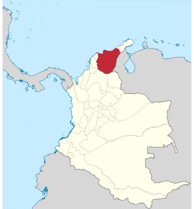
Situation de la ville Santa Marta sur la carte de la Colombie

engagements pris dans le cadre de l'Accord de Paris. Étaient également représentés des gouvernements infranationaux, des universitaires, des mouvements sociaux, des ONG, des syndicats, des parlementaires, le secteur privé, des banques multilatérales de développement, des peuples autochtones, des personnes d'ascendance africaine, des paysans, ainsi que des femmes, des enfants et des jeunes gens.