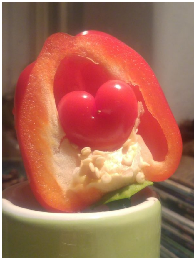
En février 2019, je préparais un repas pour une personne qui m'était chère, mais avec laquelle j'étais un peu en froid à ce moment-là. Je coupai un poivron en deux pour enlever les graines, et voilà ! Je trouvai ce cœur. (C. Q., Amsterdam, Pays-Bas)