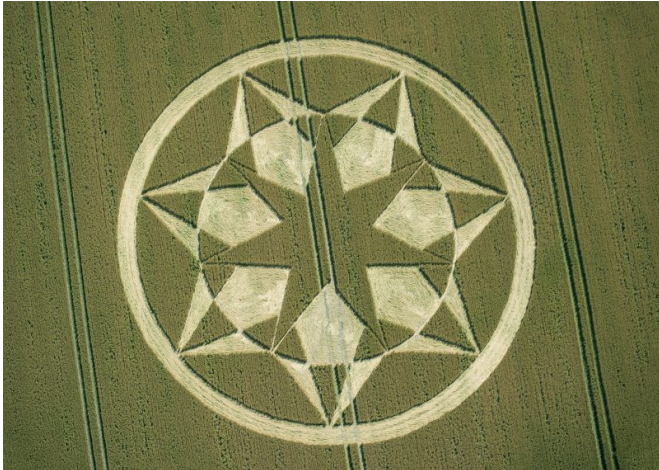
Agroglyphe photographié à Marten (Royaume-Uni), le 23 juillet 2024.

Partage international n° 434 - Octobre 2024