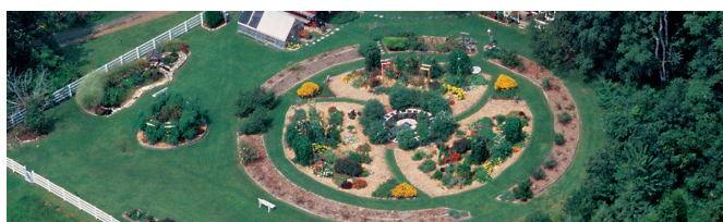
Vue aérienne de Perelandra