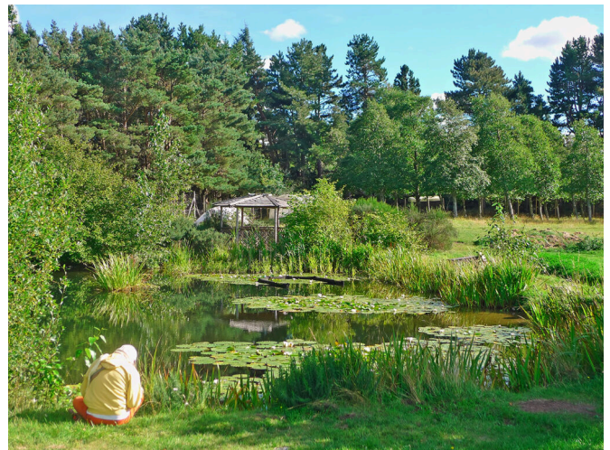
Lac dans les jardins de Cullerne, Fondation Findhorn

Au cours de la deuxième saison de culture, par exemple, alors que les choux rouges pèsent normalement environ quatre livres à maturité, deux d'entre eux, à Findhorn, atteignirent 38 et 42 livres !